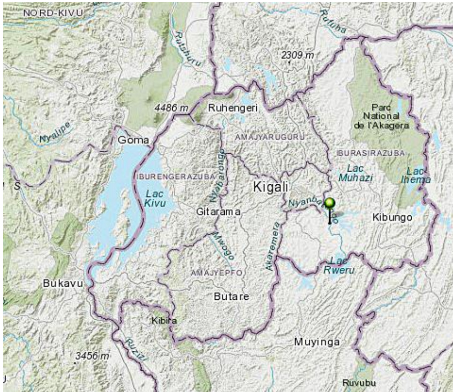
Figuur 1. Ligging van de polders in Rwanda